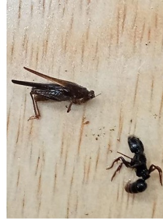
Jangkrik dan Semut hitam